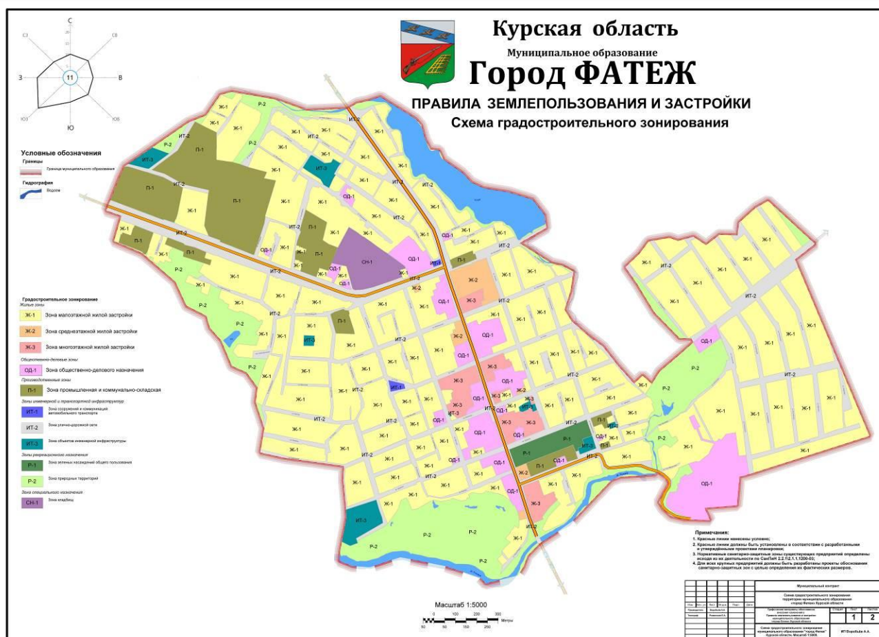
Рис.1. Схема градостроительного зонирования территории муниципального образования «город Фатеж» Фатежского района Курской области