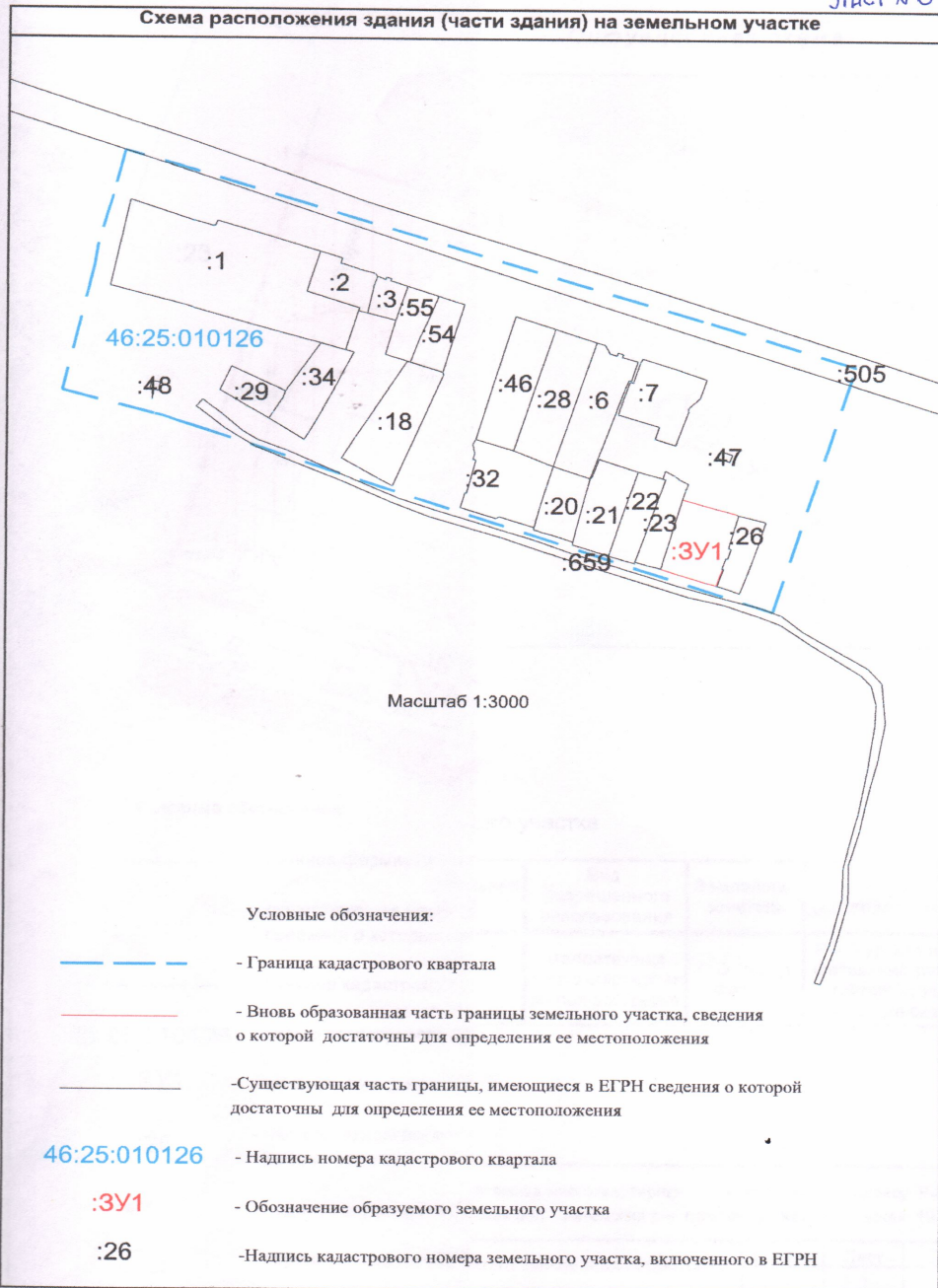
Схема расположения здания (части здания) на земельном участке