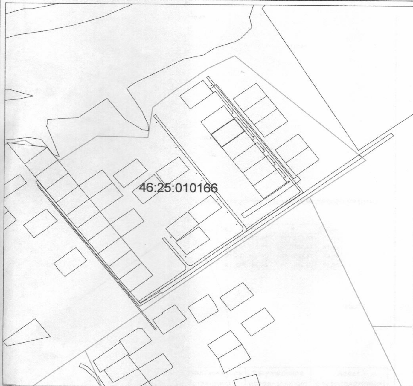
Схема расположения земельных участков