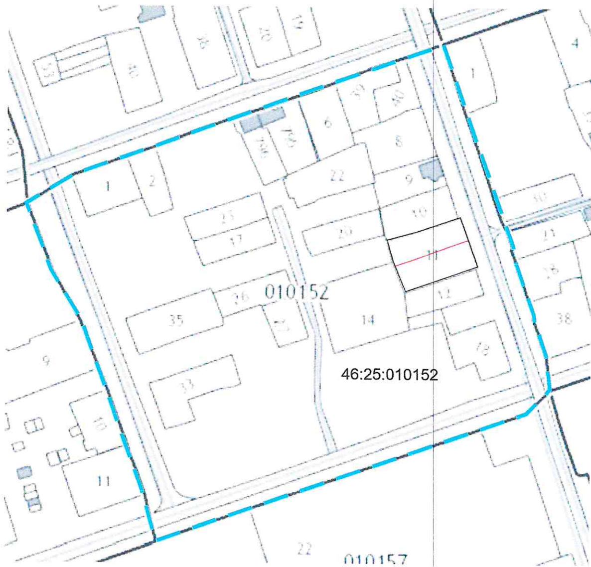
Схема расположения земельного участка на кадастровой основе