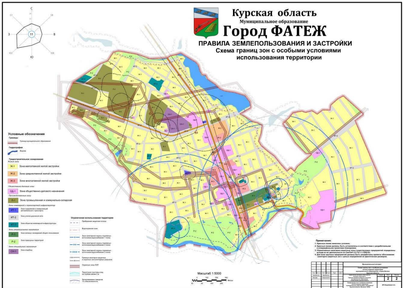
Рис.2. Схема границ зон с особыми условиями использования территории муниципального образования «город Фатеж» Фатежского района Курской области